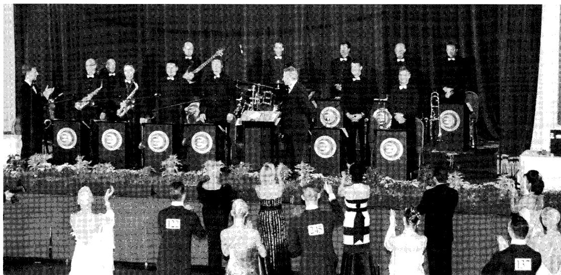
ブラックプールの競技終了後、選手、ジャッジ、そして満場の観衆に讃えられるエンブレスオーケストラ