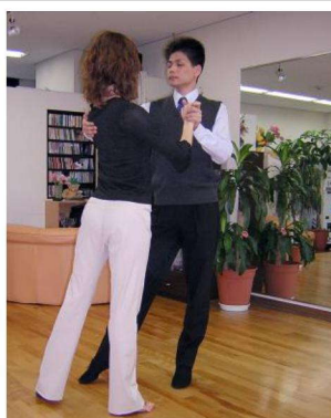
3歩目までは、ベーシックと同じ動きです