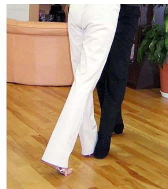
4歩目。男性の足の間に女性の左足前進