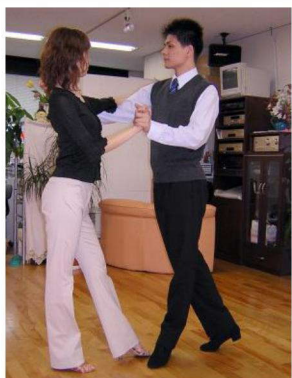
1歩目はベーシック・ステップと全く同じ動きです